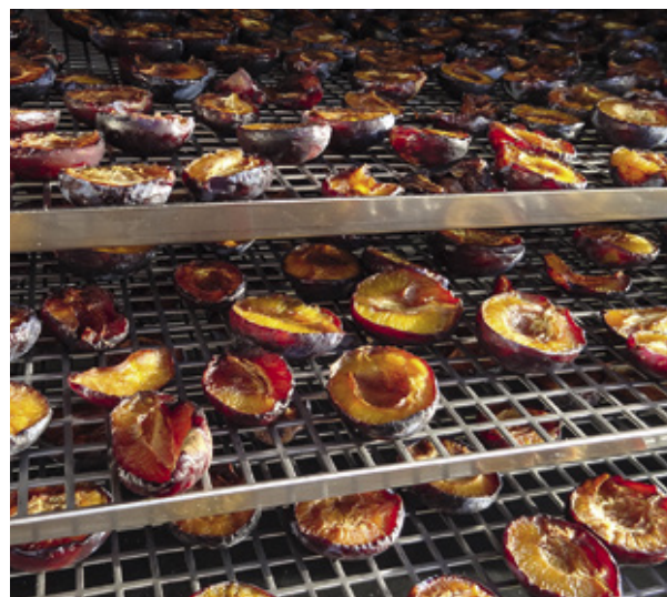
Damit Pflaumen gut trocknen, die halbierte Frucht mit der Schale nach unten auf ein Gitter legen.

der Schale nach unten auf ein Lochblech legen. Das gilt im Übrigen für alle Obstsorten. Die Schnittfläche gehört nach oben, da so die Wasserabgabe an die Trocknungsluft leichter funktioniert.