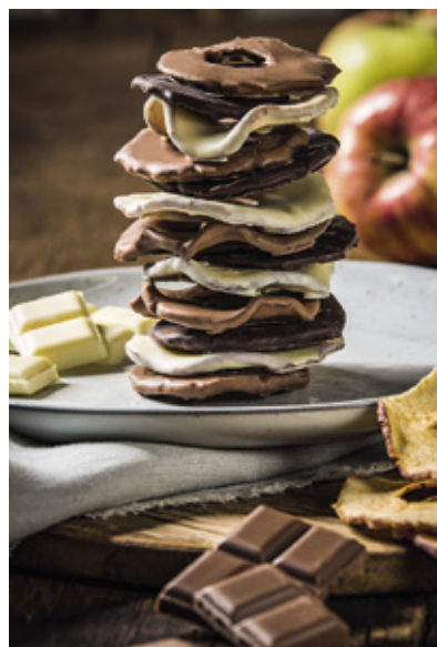
Etwas Süßes für Naschkatzen: Mit Vollmilch überzogene Früchte sind besonders beliebt..

Hierfür sollte die Auflösetemperatur beispielsweise bei 42 bis 43 °C liegen. Konditoren halten sich dabei genau an eine vorgeschriebene Temperaturkurve und setzen für die Produktion gro-