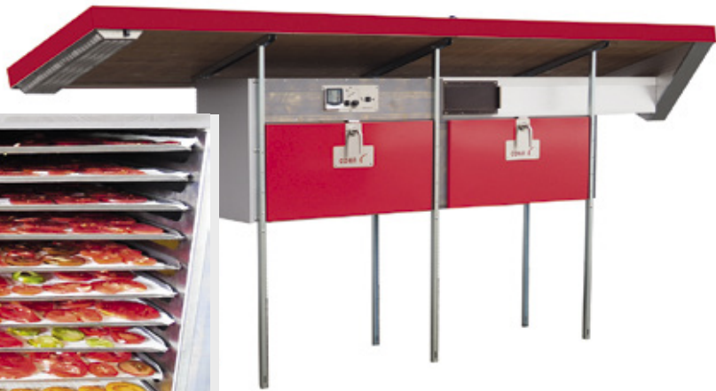
Der Solartrockner SF50s von Cona ist für den Außenbereich konzipiert.

felchips eine Restfeuchte von 5 bis 7 %. Abhängig von Fruchtsorte, Leistung des Trockenschrankes, Menge der Ware im Schrank und der Witterung benötigt sie für die Herstellung der Apfelchips 6 bis 20 Stunden. Die feuchte Abluft wird dabei nach draußen abgeführt. Je nach Größe, Ausführung und Ausstattung kosten Profi-Warmlufttrockner zwi-