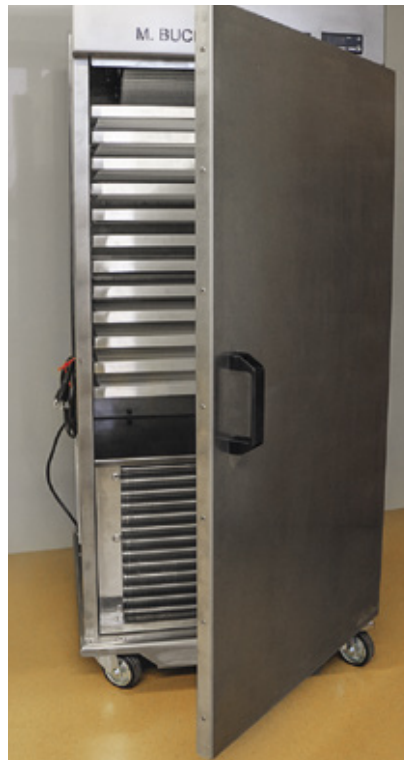
Knapp 8000 € kostet dieser Frischlufttrockner mit Kondensationstechnik (Typ 16) der Firma M. Bucher AG.

Umgebungsluft oder bei tieferen Umgebungstemperaturen sinnvoll. Die optimale Umgebungstemperatur beträgt bei Frischlufttrocknern 18 bis 25 °C und bei Umlufttrocknern 10 bis 25 °C.