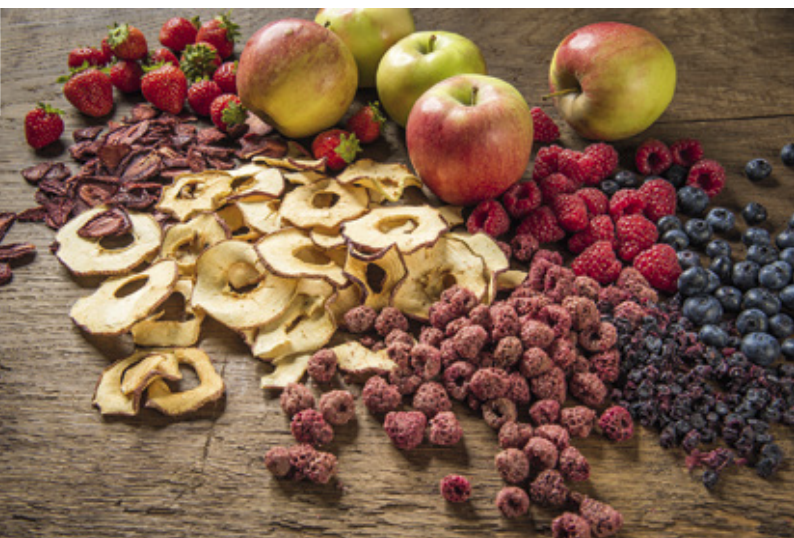
Früchte zum Dörren sollten reif, frisch geerntet, sauber und natürlich frei von Faulstellen, Schädlingsbefall, Pilzkrankheiten oder Druckstellen sein.